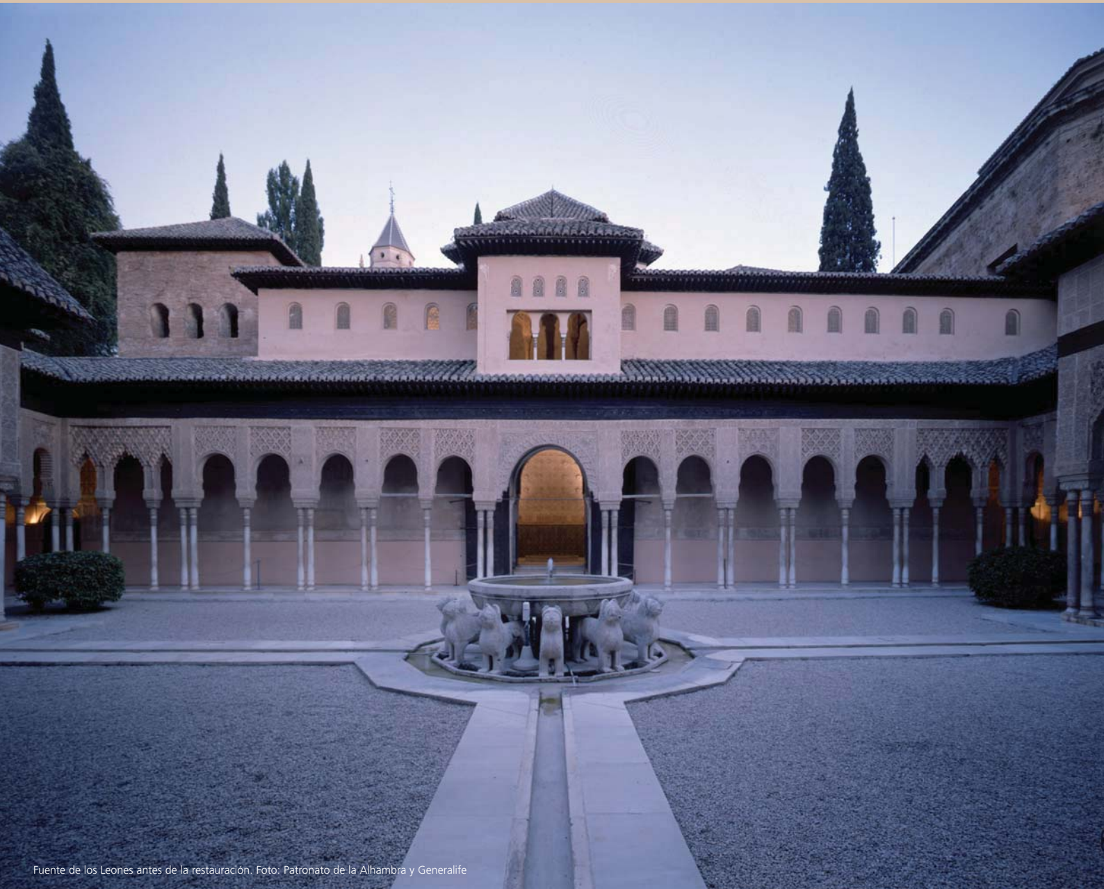
Fuente de los Leones antes de la restauración.

cando la importancia de los estudios previos en este momento inicial del proyecto. Entre otros, se sugiere realizar un análisis microclimático general, conocer en profundidad los materiales de la fuente y aquellos potencialmente utilizables en la restauración, y revisar el sistema hidráulico del palacio. Estos planteamientos se