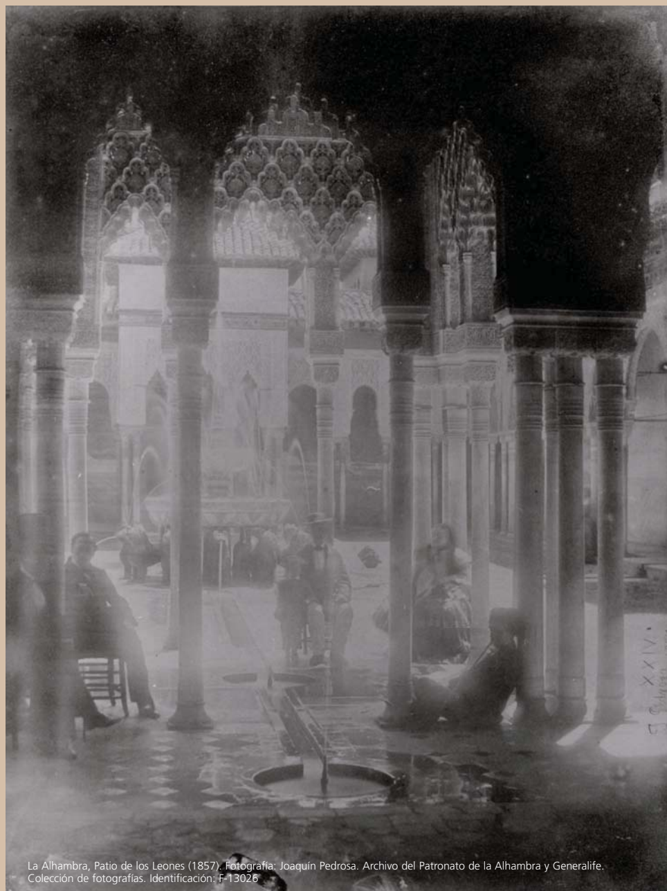
La Alhambra, Patio de los Leones (1857). Identificación: F-13026

La formulación de cualquier proyecto de conservación y restauración debe estar precedida de un conocimiento suficiente