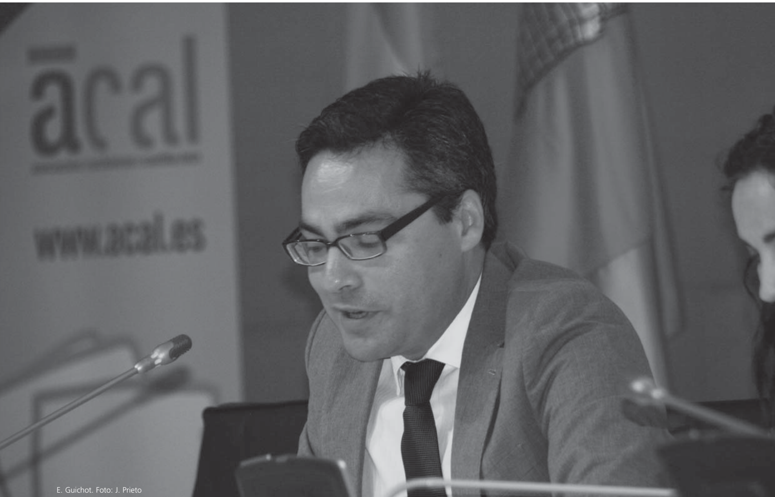
E. Guichot.

dando al periodista o al ciudadano un estatus de observador privilegiado de lo que ocurre en las administraciones públicas y en las relaciones de estas