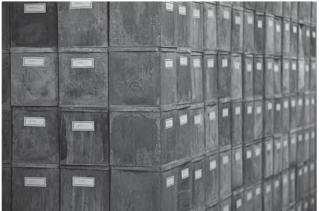
The Work People of Halifax. Christian Boltanski

Una peculiar obra de la artista Hanna Darboven, llamada Ein Jahrhundert One Century , 1971-75, en la que unas estanterías totalmente abarrotada de cajas negras es un buen ejemplo de la poética y política que estos instrumentos contienen en sí, proyectándolos cuando se los saca a la sala blanca. La obra consiste en 402 libros, cada uno de los