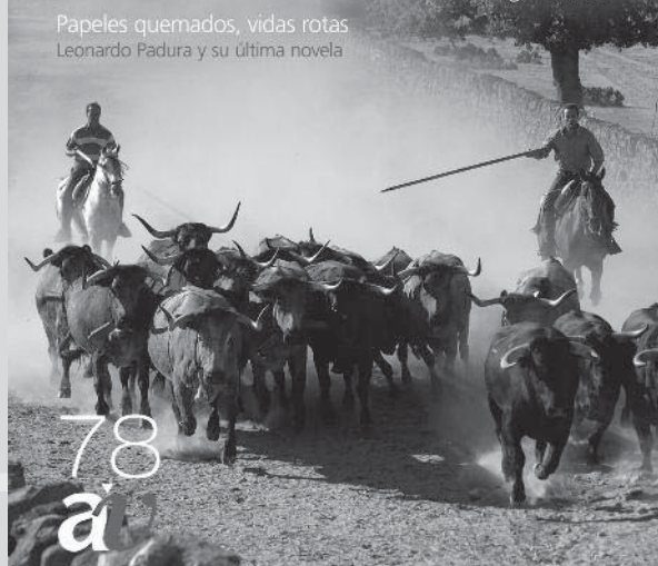
Toros en el archivo

Toros en el archivo los secretos del éxito de una ganadería