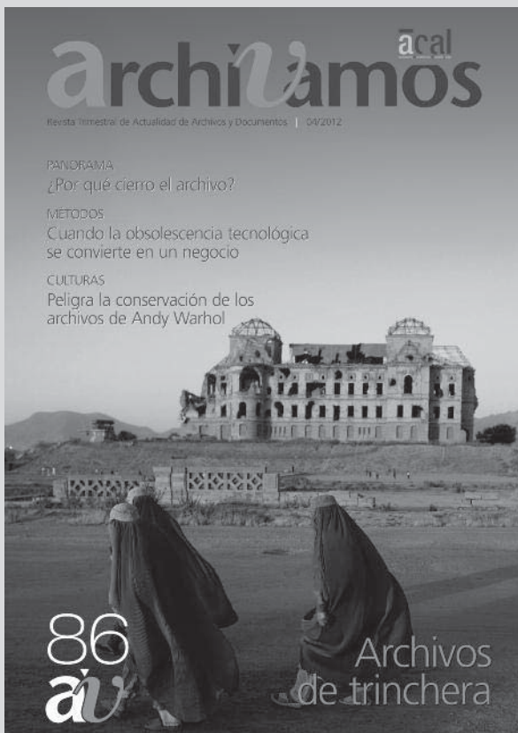
Afganistán. Archivos de trincheras

Y como se enfrentaban a retos similares los participantes en las revueltas de la plaza Tahrir de El Cairo, el movimiento de los paraguas de Hong Kong u Occupy Wall Street. Y sin salir de EE.UU. vimos que gracias a las nuevas tecnologías los movimientos sociales actuales pueden conectar con las experiencias de movimientos sociales pasados gracias a archiveros que quieren mantener viva la memoria de conflictos ya olvidados.