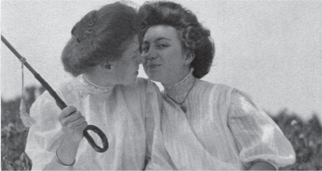
imagen. Según cuenta, todo empezó cuando su abuelo le entregó una foto tomada a finales del siglo XIX, en la que aparecía su tío abuelo Clarence, el solterón de la familia. Rápidamente se sintió identificado con ese eufemismo con el que no hace demasiado tiempo se nombraba a los homosexuales. Su gran afición por la fotografía terminó de alentar su curiosidad por reunir imágenes antiguas de personas LGTB, especialmente de la primera mitad del siglo pasado, que ha estado recopilando

H oy en día pocas cosas nos resultan más sencillas que inmortalizar un momento vivido. Todos llevamos en el bolsillo una potente cámara fotográfica desde la que enviamos rápidamente la imagen que hemos capturado. Las aplicaciones para retocarla son numerosas, los selfies compulsivos forman parte de la rutina diaria de muchos y tenemos una capacidad para almacenar instantáneas cada vez mayor. En definitiva, la generalización de la fotografía ha permitido democratizar esa capacidad, mágica aún, de revivir momentos pasados. Todo lo positivo que ello conlleva quizá nos ha hecho olvidar lo que hace décadas tenía de solemne obtener una foto.