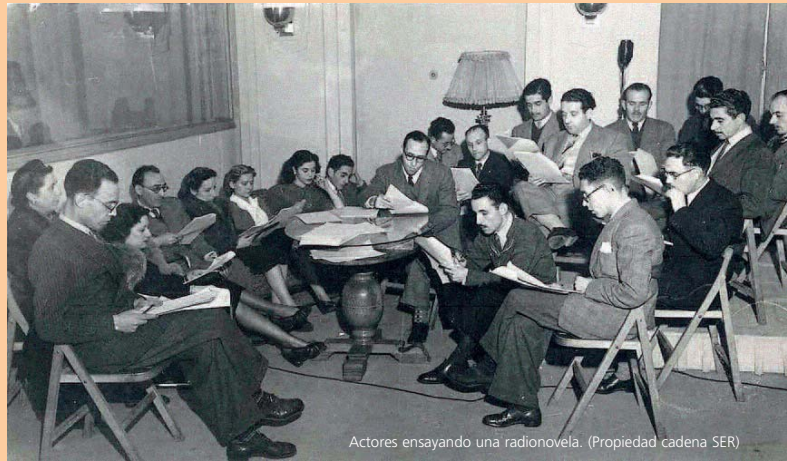
Actores ensayando una radionovela.

En este panorama hay una excepción: las radionovelas y los seriales. La razón de que la cadena SER haya conservado cientos de radioteatros y dramatizaciones es simplemente técnica. En los años 40 y 50 no existía la posibilidad tecnológica de emitir en cadena. Para suplir esta carencia, se enviaba desde Madrid a todas y cada una de las emisoras del grupo una copia en cinta del capítulo a radiar cada día. A cierta hora convenida, todas las emisoras accionaban a la vez el “play”. Y ya teníamos nuestra falsa cadena, emitiendo a la vez para toda España “Ama Rosa” o el “Teatro del Aire”. El master de todas aquellas grabaciones se guardaba en Radio Madrid para posibles nuevas emisiones. Y de ese modo hemos podido recuperar, andando el tiempo, 17.000 cintas que constituyen el archivo histórico de la SER, una minucia comparada con