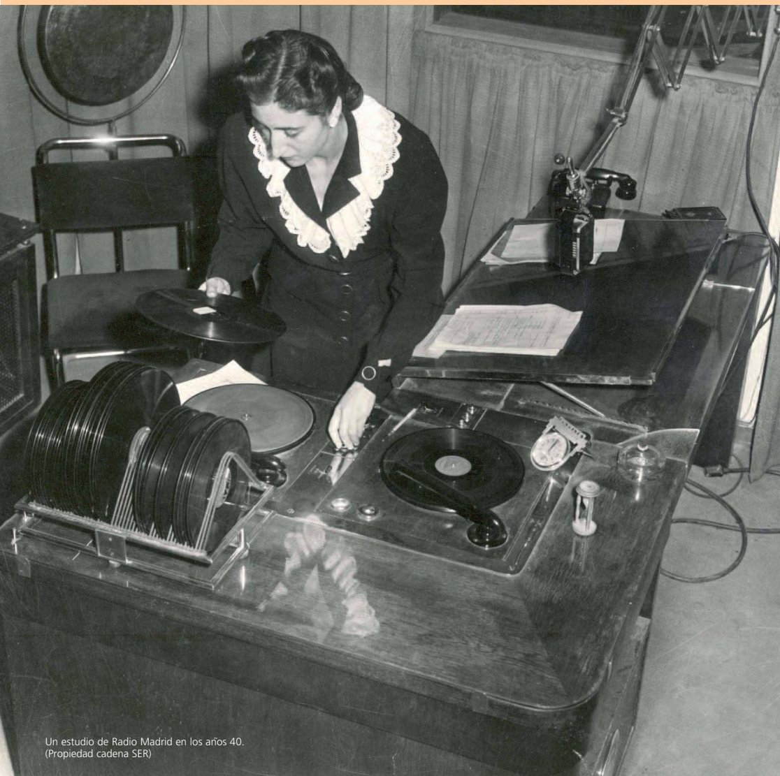
Un estudio de Radio Madrid en los años 40.

casos a instituciones donde continuarán amontonados en la más triste oscuridad.