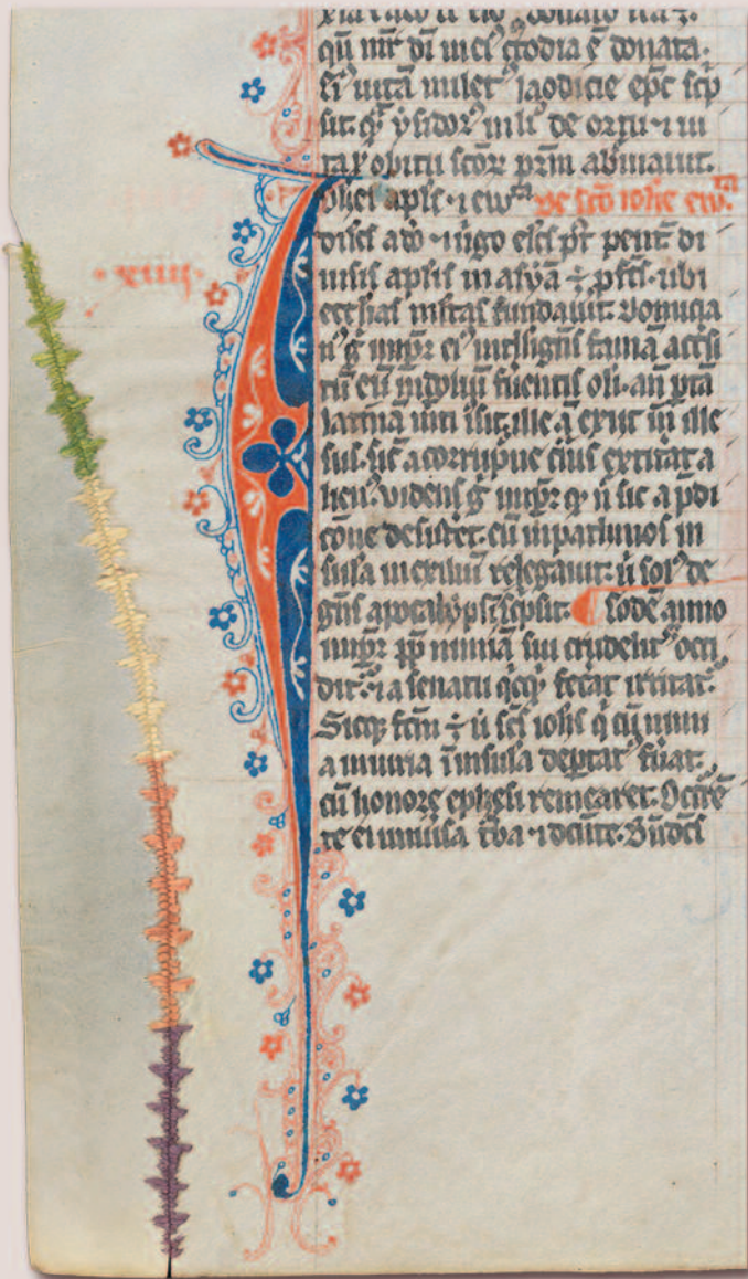
En la Universidad de Friburgo, Suiza, podemos encontrar un manuscrito del siglo XIV en cuyas páginas advertimos finas puntadas de color verde y rosa que han sido empleadas para

reparar artísticamente un desgarrado. En otras partes del manuscrito, hallamos reparaciones de diferentes formas, tamaños y colores, que proporcionan al manuscrito de una belleza increíble. Pero hay más ejemplos. En la Abadía de Engleberg, también en Suiza, se custodia otro de estos ejemplares reparados: en el extremo de sus páginas se han tejido una especie de cuerdas con las que se han reforzado los bordes del pergamino. En ocasiones, estas costuras no eran la única forma de mejorar estos pergaminos. Por ejemplo, tenemos el caso de un texto de la Biblioteca Estatal de Bamberg, Alemania, en el que las costuras han rodeado el dibujo de un hombre para que parezca su esqueleto. De esta forma, las reparaciones de agujeros