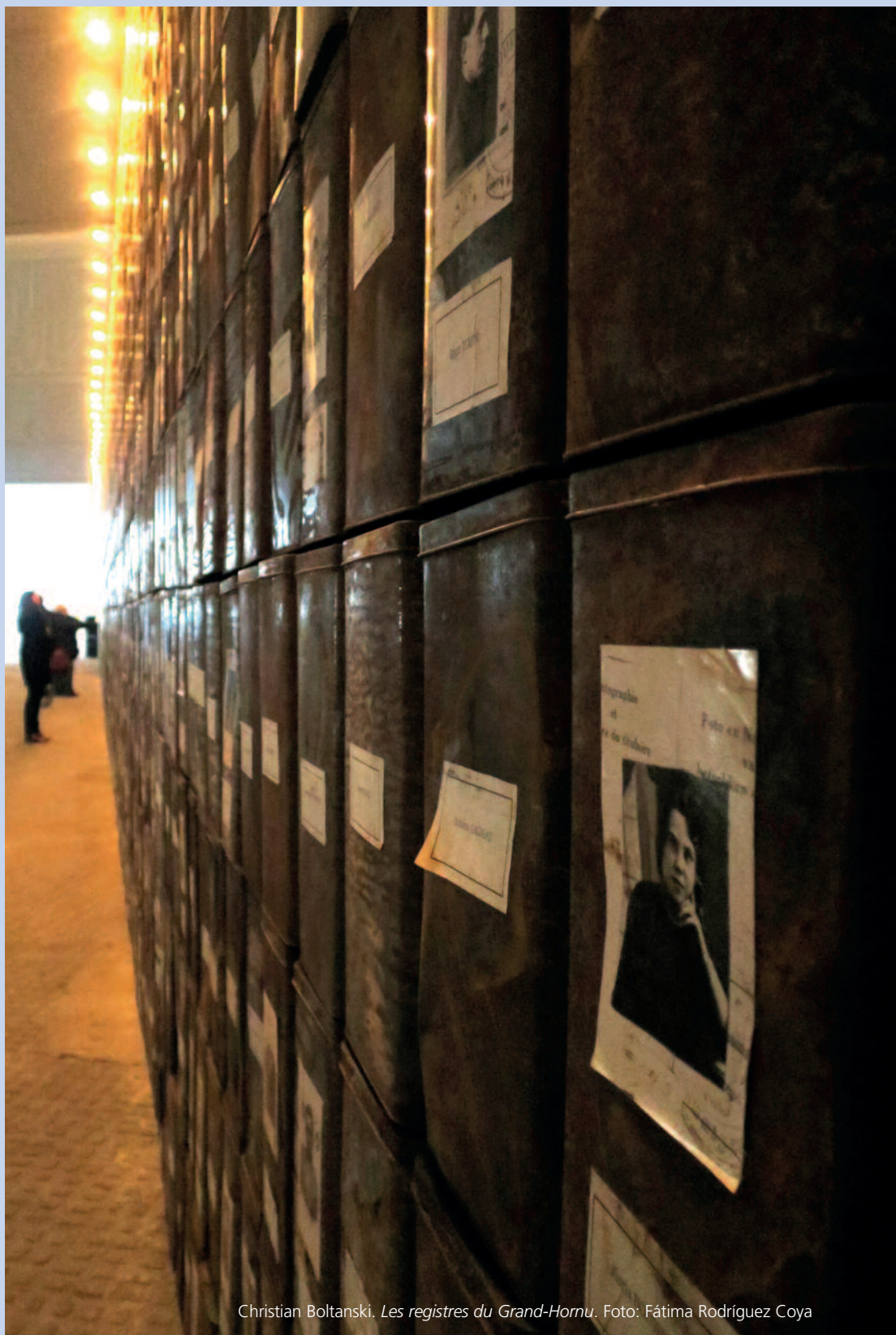
Christian Boltanski. Les registres du Grand-Hornu .

Tal vez se necesita en España una urgente política de coordinación sobre las donaciones, depósitos y otras figuras con respecto al ingreso de archivos privados —a veces también de carácter público— en bibliotecas. Es perentorio establecer unas directrices, tal vez coordinadas por aquellas estructuras administrativas que tienen la competencia sobre los archivos —siguiendo el modelo de NARA— entre otras cosas para que los archivos, fondos documentales y documentos reciban una tratamiento archivístico allí donde estén conservados, también en las bibliotecas, y evitar, con ello, afirmaciones como éstas: el archivo personal “se distribuirá en siete apartados según el formato de los documentos: correspondencia, fotografías, manuscritos de obras literarias, textos y artículos, libros y revistas...”. La coordinación, en este sentido también se hace necesaria con respecto a una política de difusión, pues en muchos casos no es fácil imaginar ni deducir dónde pueden estar los documen-