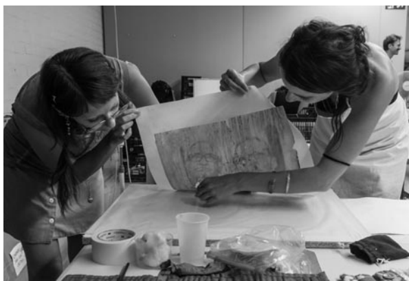
Figura 13. Laminación de un dibujo. ©José Ferrero

Aunque el proyecto se centra en el rescate y salvaguarda, resulta imprescindible realizar ciertos tratamientos para poder devolver las imágenes a las familias