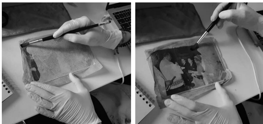
Figuras 15 y 16. Fotografía con papel pegado en emulsión. Aplicación de Ciclometicona D5 para transparentar al papel. Paso previo a la digitalización.

La digitalización constituye la última fase del proceso y tiene como objetivo garantizar el acceso y la preservación digital de los contenidos. En los casos en los que las familias han aportado pocas fotografías o cuando se trata de imágenes muy antiguas, se genera un archivo digital complementario. La digitalización se lleva a cabo con cámara fotográfica sobre una mesa de reproducción, ya que el uso de escáneres resulta poco adecuado para copias deformadas o con restos de barro.