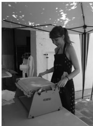
Figura 11. Esmaltadora.