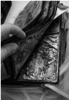
Figura 7. Álbum con barro.