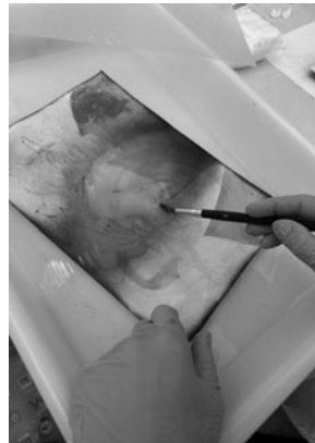
Figura 9. Lavado.