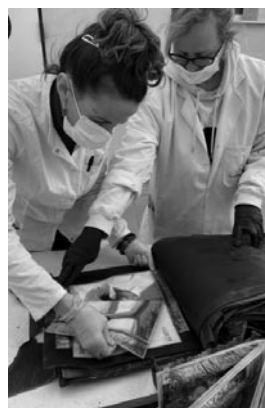
Figura 14. Álbum afectado.