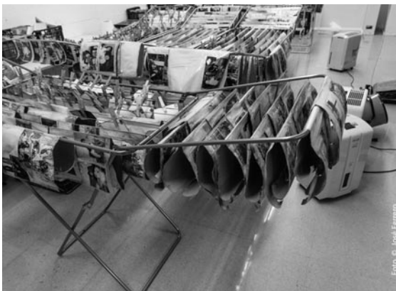
Figura 5. Secado.

Si existe la posibilidad, se recomienda congelar todo lo posible (figura 6). En nuestros laboratorios, por limitaciones de espacio y falta de recursos, solo se han congelado las fotografías con presencia de hongos o aquellas que se llegaron en días con mucho volumen de entregas. Cada lote se guarda en bolsas cerradas, etiquetadas con los datos de identificación y el contenido.