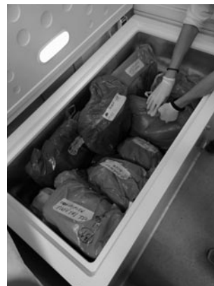
Figura 6. Congelador.