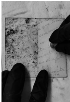
Figura 8. Limpieza.