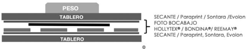
Figura 10. Esquema del “sándwich” de secado

Para las copias en blanco y negro (gelatinobromuro de plata), cuyo soporte es papel, el alisado se puede realizar únicamente mediante peso. Tras sacarlas de la cubeta, se aconseja dejar escurrir ligeramente el agua por una esquina y colocarla entre capas de Hollytex® y secantes. Encima se coloca un tablero con peso, y se van cambiando los secantes cada 24 horas hasta que la obra esté completamente seca. Como alternativa más sostenible a los secantes tradicionales, se está extendiendo el uso de Evolon®, un tejido técnico de microfibras desarrollado por Freudenberg Performance Materials. Este material no tejido ( nonwoven ), compuesto por microfibras muy finas de poliéster y poliamida, es altamente absorbente y, a diferencia de los secantes tradicionales, puede lavarse y reutilizarse infinitamente. Otros materiales similares son Paraprint® o Sontara®. La estructura de este “sándwich” de secado se muestra en la figura 10.