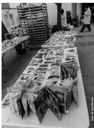
Figura 3. Secado.

El Ayuntamiento de Aldaia tuvo una iniciativa interesante que consistió en hacer un llamamiento y una recolección de las fotografías ya retiradas de sus álbumes y ya secas o casi secas. Gracias a este paso previo, estas fotografías llegaron al laboratorio del Museo de l'Horta Sud en Torrent ya estabilizadas y en un estado mucho menos urgente, lo que facilita enormemente su conservación y tratamiento. Sin embargo, esto no ha sido lo habitual. La inmensa mayoría del material se ha entregado empapado de fango dentro de bolsas. Fotografías sueltas, álbumes y otros documentos u objetos suelen aparecer mezclados, a menudo pegados entre sí. Airear y secar las piezas es la prioridad para evitar la aparición de microorganismos, que las obras se adhieran entre sí o que las tintas y colorantes de las fotos en color sangren y se corran o transfieran a otras superficies. Estas tareas son esenciales para frenar el deterioro y prevenir la pérdida irreversible del material.