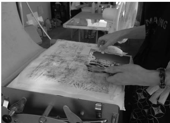
Figura 12. Sacando las fotos de la esmaltadora.