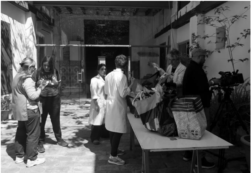
Figura 2. Momento de recepción de una colección de vídeos domésticos.

En el Museo Comarcal de l'Horta Sud, la catalogación comenzó con un registro básico en una hoja de Microsoft Excel. Sin embargo, al cabo de mes y medio los datos se trasladaron a Notion, una aplicación que permite tomar notas, gestionar tareas, crear bases de datos, planificar proyectos, almacenar documentos e imágenes y trabajar de forma colaborativa en tiempo real. En esta base de datos se registran los datos de contacto de la persona que entrega el material, el número de álbumes u objetos recibidos, su estado de conservación y se adjuntan fotografías preliminares tomadas en ese momento. Cada familia recibe un código único, que incluye el nombre del laboratorio, las iniciales de la persona que entrega el material y el número de familia, lo que permite un seguimiento organizado y seguro de todas las piezas.