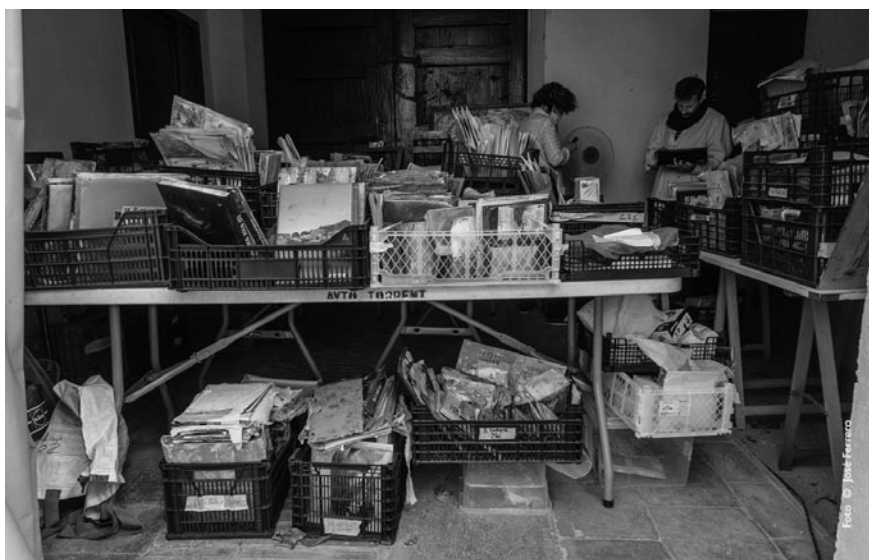
Figura 1. Espacio de almacenamiento temporal en el patio del Museo Comarcal de l’Horta Sud, donde se almacenaban las obras en espera de ser procesadas.

Un aspecto a destacar es el compromiso social de los museos locales: la totalidad de los laboratorios de campo se ubican en espacios museísticos, que se han implicado en todos los niveles para facilitar los espacios y recursos necesarios para la recuperación de las fotografías, la atención a las familias y voluntarios, y la difusión del proyecto.