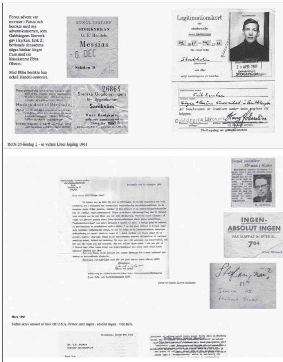
Figura 3. La historia en curso

La historia continúa, día a día. Vemos los antecedentes de los Post-it en la puerta de la nevera con preguntas de exámenes, listas de compra, entradas de cine y de conciertos y montones de fotografías de visitas al dentista. Nos da una visión de su vida cotidiana y familiar, algo que jamás he encontrado en los archivos. Soy más joven que los hijos de esta familia, pero seguí sus pasos. Viví en el mismo lugar, fui a las mismas escuelas, así que inmediatamente me reconocí.