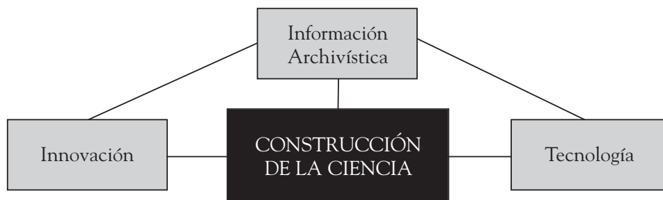
Ilustración 1. Ubicación de la Archivística en el esquema de relaciones en el proceso de construcción científica