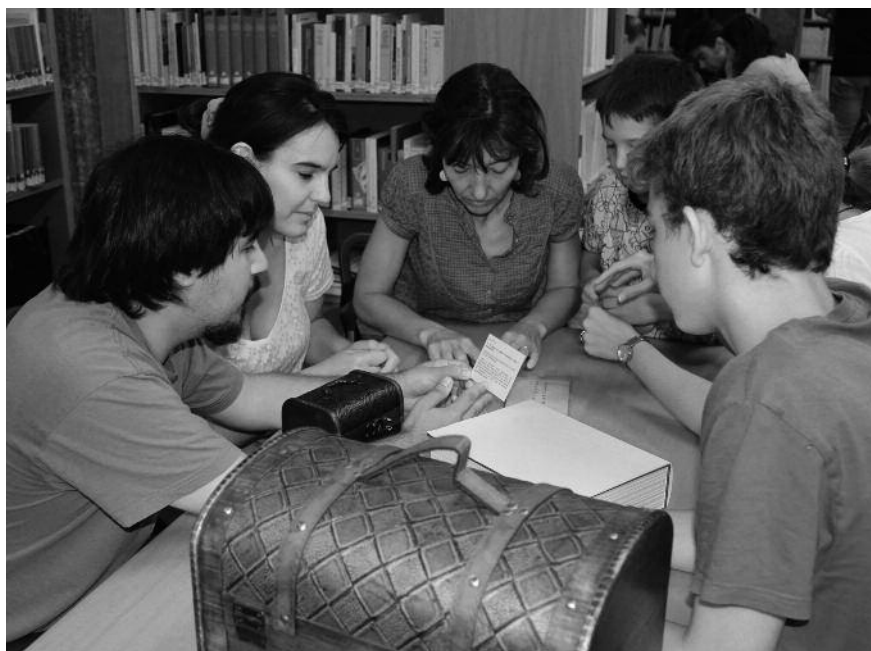
Imagen 1. Escape room del Archivo Municipal de Girona, Día Internacional de los Archivos, 2017

El objetivo de la actividad del AMGi, “Descubre los secretos del Archivo Municipal”, era acercar el archivo a los ciudadanos difundiendo su contenido. La actividad consistía en un juego de mesa apto para jugar de 2 a 5 personas con game masters y replicado para poder absorber más participantes. Las pruebas se realizaban con copias de documentos custodiados en el AMGi y el Centre de Recerca i Difusió de la Imatge (CRDI) y con información adicional sobre éstos. El objetivo del juego era superar unas pruebas de selección de personal para el Archivo Municipal de Girona.