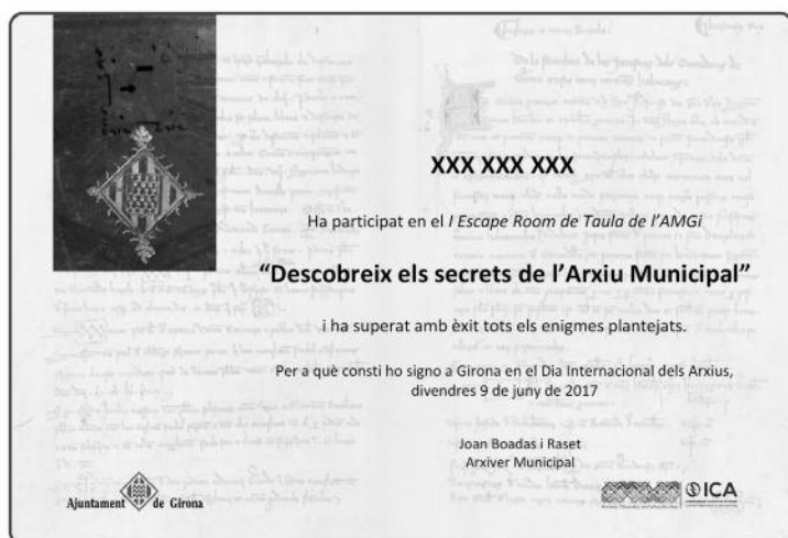
Imagen 4. Diploma de la actividad “Descubre los secretos del Archivo Municipal” para los participantes

Los participantes de esta jornada consiguieron un estupendo diploma nominativo firmado por el archivero municipal como recuerdo de la actividad.