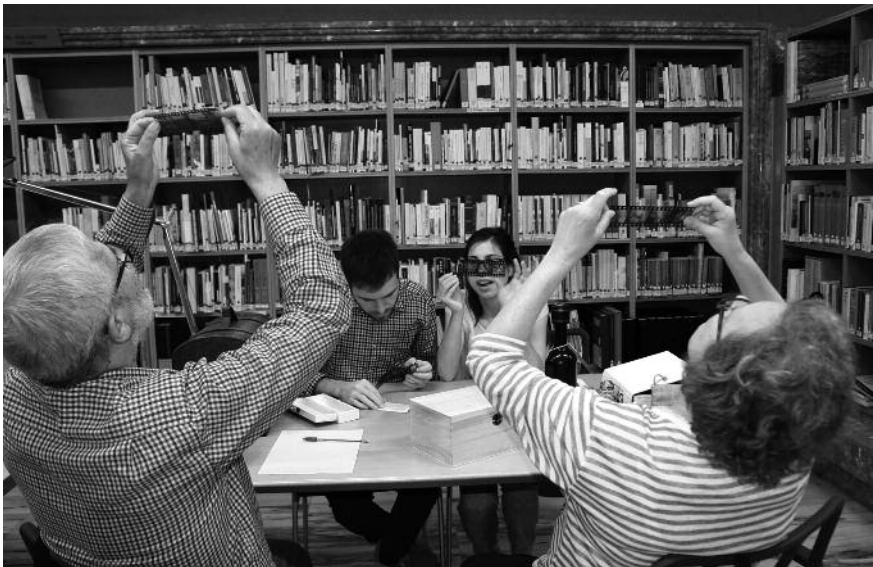
Imagen 2. Escape room del Archivo Municipal de Girona, Día Internacional de los Archivos, 2017

Se pensó que era una muy buena actividad para celebrar el Día Internacional de los Archivos acercando el archivo a los ciudadanos y difundiendo su contenido. El objetivo era atraer a nuevo público mostrando parte de la documentación, aunque fuera de forma muy general y sobre todo pasárselo bien.