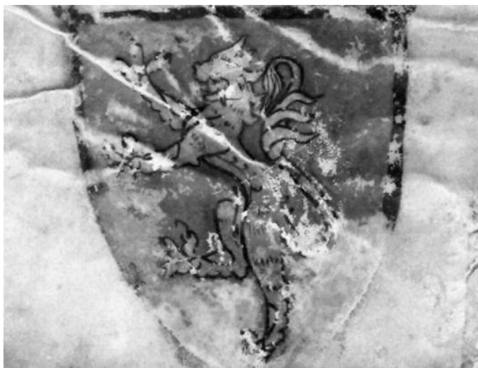
Fig. 3. Escudo del baile Bernat Lleó 9

La selección del baile de Terrassa la hacía el virrey o lloctinent a partir de una terna: un candidato de la villa de Terrassa, otro de la parroquia de Sant Pere y otra del resto de parroquias del término. Cada uno de ellos era propuesto por los gremios, unión o cualquier otro grupo de presión. Los seleccionados tenían que ser mayores de 30 años, oriundos del lugar, conservar todas las extremidades y la visión, no tener ningún conflicto jurídico con ningún otro municipio, no formar parte del estamento religioso, y sobretodo haber superado la inspección de cuentas ( fer taula ) en caso de haber ocupado un cargo público con anterioridad. Para ser candidato tampoco se podía ser familiar de la Inquisición, ni trabajar a cargo de otra persona, formar parte o haber formado parte de un colectivo considerado herético.